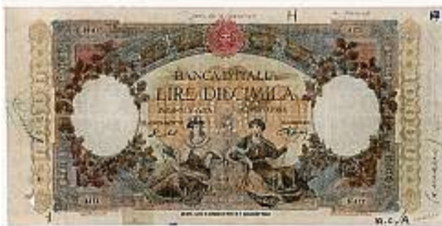
Un biglietto falso: 10 mila lire della Banca d'Italia del 1948

Una citazione d'obbligo per la raccolta di oselle dogali della Banca Popolare, che nella sede storica - palazzo Thiene ospiterà uno degli eventi collegati a Numismatica: dal 21 novembre arriva la mostra sui 2500 anni di contraffazioni, voluta dalla Guardia di Finanza e dal suo museo storico. Prima a Roma, poi a Firenze (250 mila mila visitatori), a Vicenza porterà falsi dall'antica Grecia ai giorni nostri: compresi mezzi pound per 300 mila euro individuati in aprile in una zecca clandestina ad Arezzo. ♦ N.M.