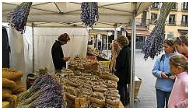
Un banco di lavanda e profumi d'oltralpe.