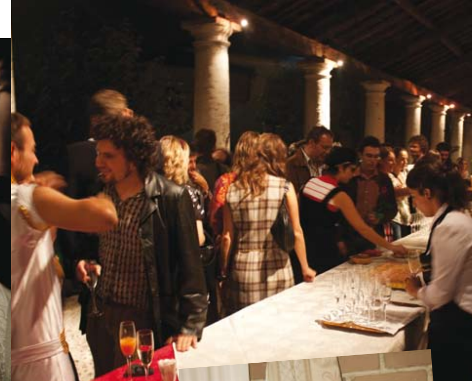
Nelle immagini Alcuni momenti dell'ultima "Cena con delitto" svoltasi a Villa Godi Malinverni